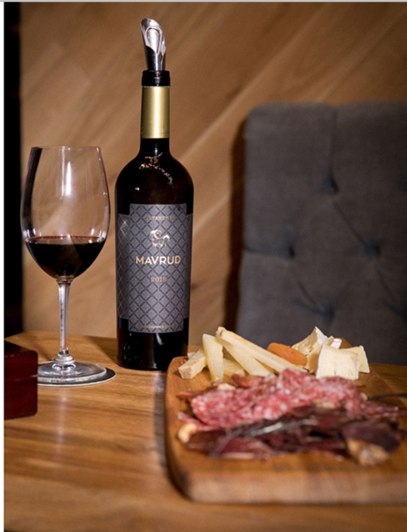
Благодарим на La Maison de Katarzyna за гостоприемството